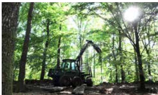
Stockmattor placeras varsamt över de gamla grävda diken.

«Det känns väldigt bra att arbetet är igång. Ända sedan jag tog över fastigheten 2004 har jag velat restaurera parken.»