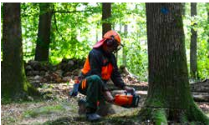
Avverkningen sker enbart med motorsåg. Fällningen planeras noga...