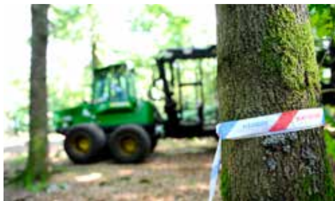
...tillsammans med skoterförelaren så att körningen i beståndet blir minimal.