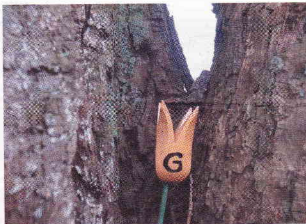
Tio bokstäver är målade på trätulpaner som placerats ut på olika ställen i naturen.

Syftet med skattjakten är att få fler barn och barnfamiljer att intressera sig för områdets spännande historia.